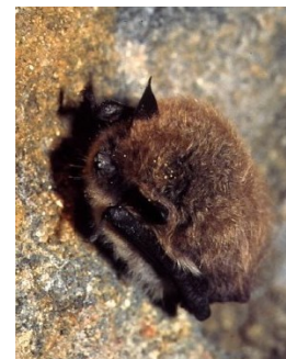
Murin à oreilles échanquées